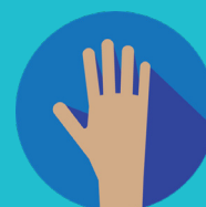
SÉQUESE LAS MANOS.