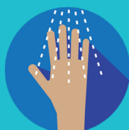
MÓJESE LAS MANOS.