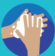
RESTRIEGUE: 20 SEGUNDOS.